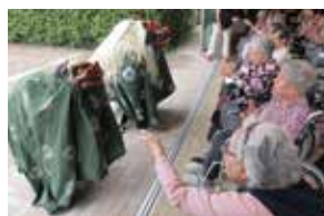
獅子舞も登場! あまりの近さに驚いてびっくりする方も!?