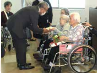
理事長から記念品を贈呈