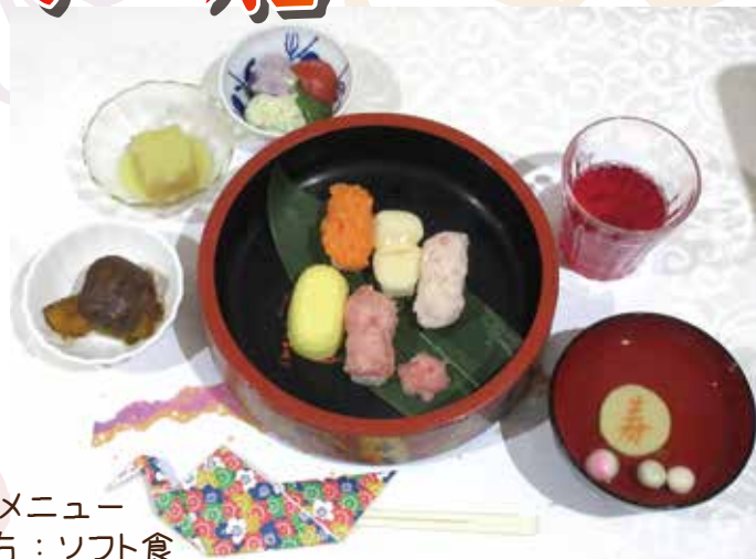
お祝い膳メニュー 左：常食 右：ソフト食