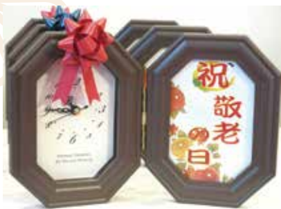
時計付のフォトフレームを差し上げました。