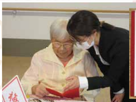
手書きのメッセージカードは職員が読み上げてからお渡しました。