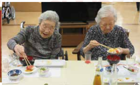
お寿司はおかわり自由です。皆様に大好評でした。