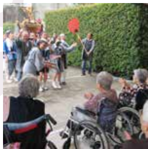
わっしょい! わっしょい!