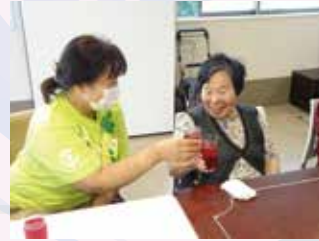
みなさんで作った「しそジュース」でカンパニー！！