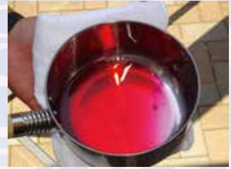
鮮やかな色にパッと変化します。 秘密の粉の正体は「クエン酸」でした！