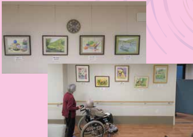
絵画を提供してくださっているユリアートクラブの皆様 ありがとうございます。

2 番街と 3 番街に飾っている絵画の張替えを行いました。 展示数も 7 枚から 9 枚に増え、まるで美術館の一角のようです。