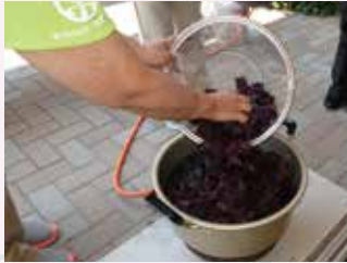
しその葉を煮だしていきます。