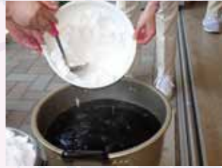
砂糖と「秘密の粉」を加えると・・・