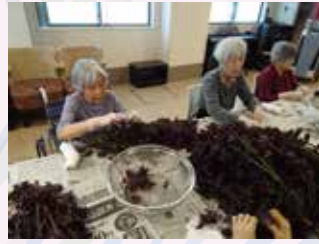
しその葉を摘んで、ご利用者 12 名総がかりで下準備。