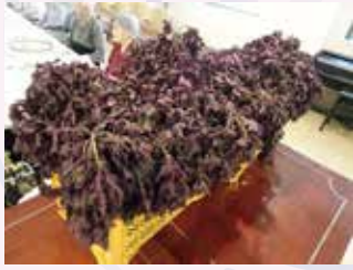
コンテナ2つ分の赤しそ