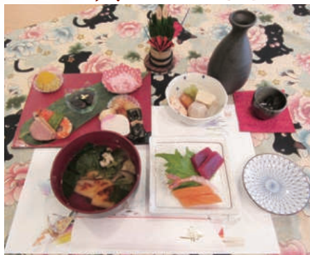
農園の野菜も使いました