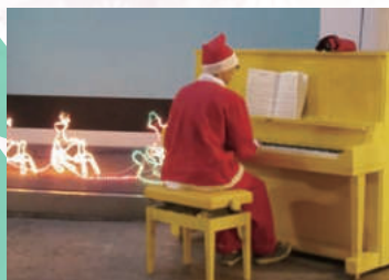
2番街の中庭でも点灯式が。ピアノを弾くサンタさんは？