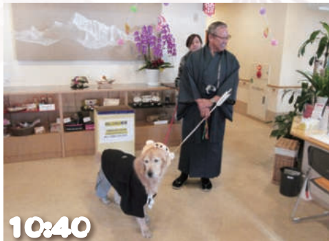
10:40 レジデンシャル常盤台に到着