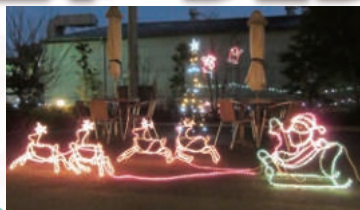
常盤台のイルミネーション