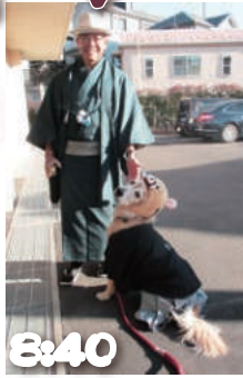
8:40 レジデンシャル百合ヶ丘に到着