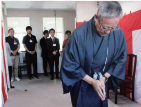
神棚に手を合わせます