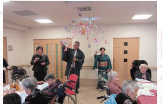
おめでとうございます!

3時間で移動した距離、約40km!! 3ヶ所の施設へ新年のごあいさつ 元旦からハードスケジュールを難なくこなす理事長! お疲れ様でした!