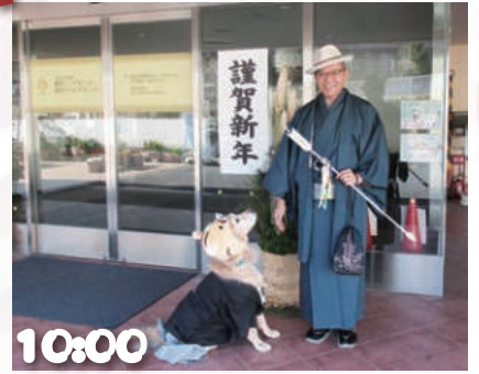
10:00 そして姉妹施設 都筑シニアセンターへ