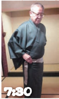
7:30 起床、まず 和服を着て...