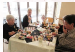
どれもおいしいね！