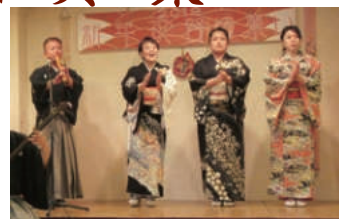
秀美会社中の歌い初め