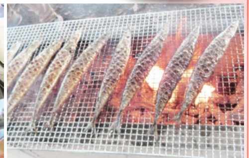
秋刀魚は炭火（備長炭）で焼くのが一番！