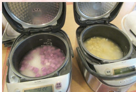
常盤台農園で収穫！さつまいもの“あいもご飯”