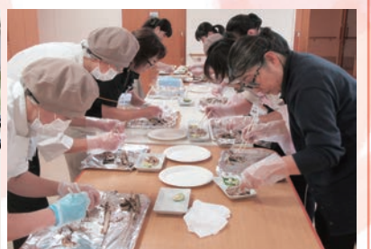
キザミ・ソフト食は丁寧に小骨を取り除きほぐします