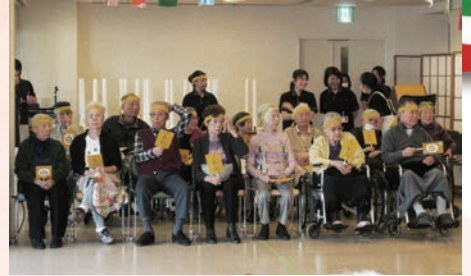
闘志あふれる各番街の勇姿！