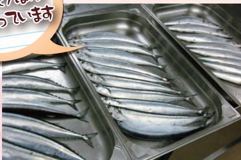
前日に塩をふります