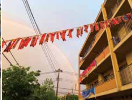
こいのぼりと虹の共演