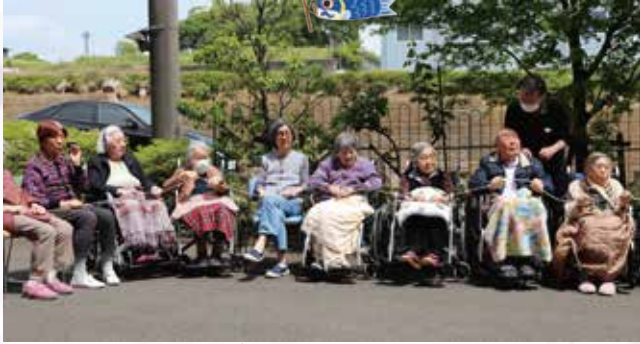
みんなで力をあわせて綱を引き