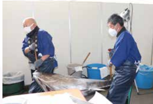
このあとマグロはづけ丼に……お寿司に……美味しくいただきました