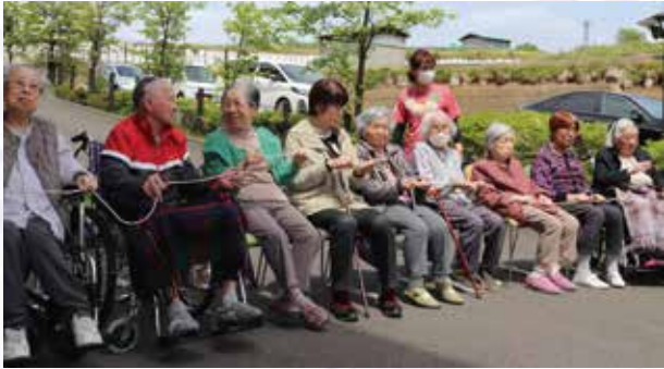
鯉たちを高く高く掲げます