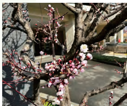
2月20日 開花しました。