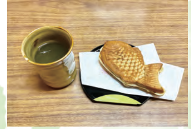
日吉東急ビル内の老舗 「十勝サザエ」のたい焼きが登場