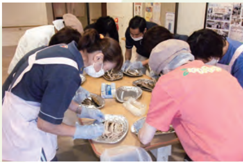
ほぐし隊の連携は見事！