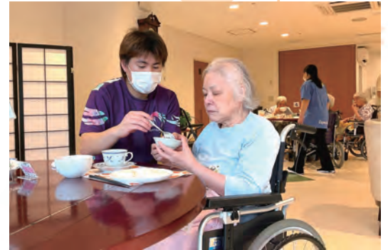
お手伝いしますよ