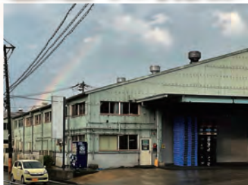
月が出た出た・虹も出た!!