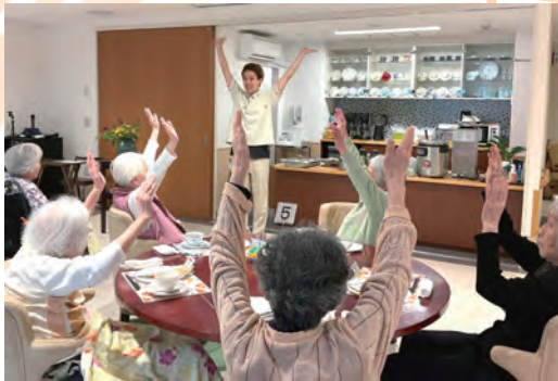
食事前の口腔体操