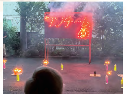
「ワンチーム」の文字が 浮かびあがる!