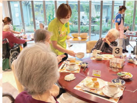
スープはいかがですか？