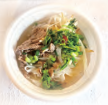
ベトナムのフォー