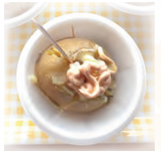
常盤台の定番! じゃがバター