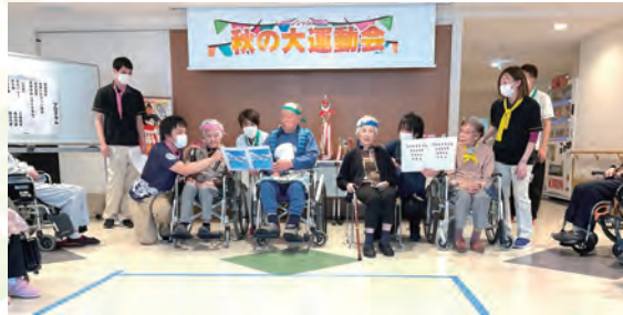
各番街代表による選手宣誓

プログラム 開会式 優勝トロフィー返還 選手宣誓 準備体操（ラジオ体操） （競技） 風船バレー 腕相撲 女尻相撲 小体操 土俵入り 閉会式・表彰 閉会の言葉 ご利用者 職員代表 職員代表 職員代表