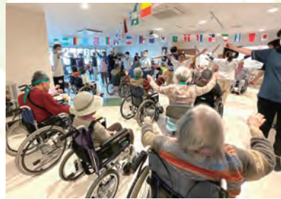
運動の前に…… みんなでラジオ体操！