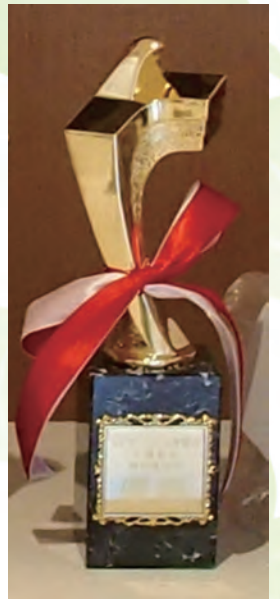
～新競技～ 腕相撲のトロフィ