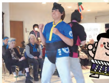
今年は勝ちますわよ？！