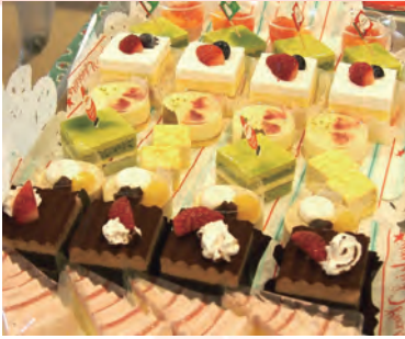
ケーキバイキングはお好きな物を好きなだけ