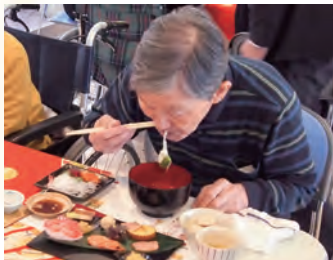
やっぱりお正月は “お雑煮”が一番！