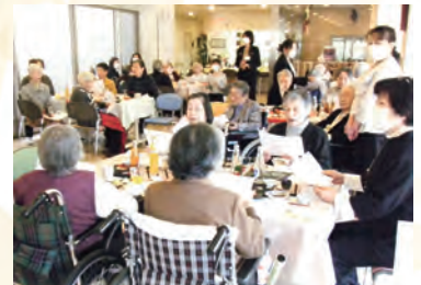
「年の初めのためしとて〜♪」