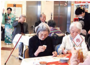
皆様明けまして おめでとうございます