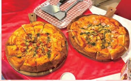
「ピザが食べたい」にお応えしてご用意