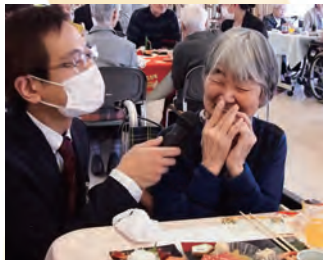
「今年の豊富？フフ…… ヒミツ……」