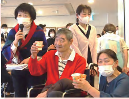
「メリークリスマス」