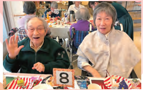
美味しい食事に「しあわせ〜」