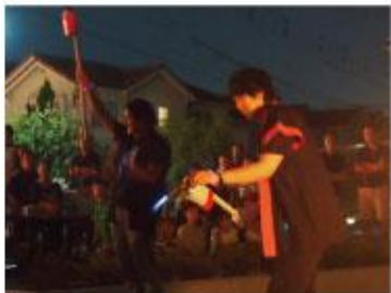
グランドフィナーレは花火！ 音楽に合わせて、次々と点火 花火師は当施設の イケメンワーカー4人衆！