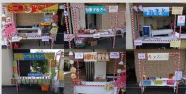
各種屋台も準備完了!