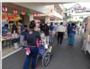
お目当ての屋台に向かう皆様 あっという間に屋台には行列が...