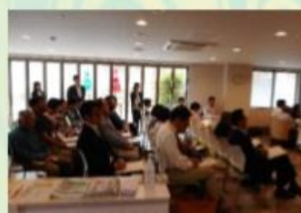
熱気ある会場、意見交換が進みます