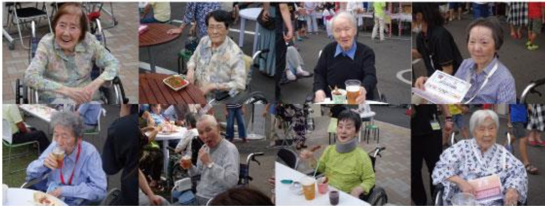
「とりあえずビール！」「じゃがバターはどこ！？」