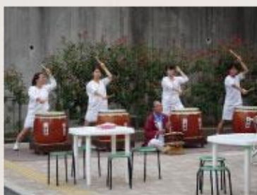
ドンドンドン! 寿太鼓の皆様による オープニングパフォーマンス