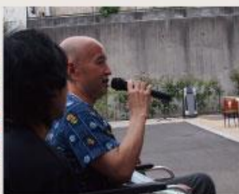
ご利用者代表による開会宣言 「みんなで楽しみましょう!」