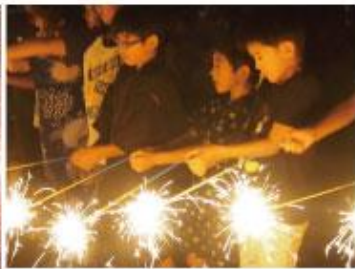
最後は子供たち 30人による手持ち花火！

西塔之越自治会の皆様をはじめ、多くの方々にご協力をいただき、 感謝申し上げます。ありがとうございました！また来年！