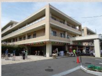
天候にも恵まれて...

西塔之越自治会やボランティアの皆様のご協力の下、 賑やかに!華やかに!開催いたしました!