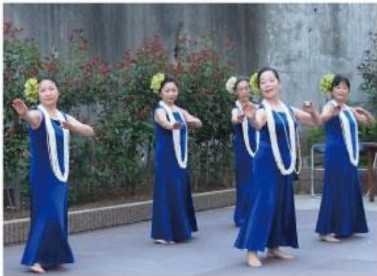
宴もたけなわ セレモニーの開幕です！ プア・ホ・アロハフラサークルの皆様による フラダンスショーに目は釘付け！「Aloha！」