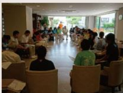
職員皆で最終打ち合わせ。 細かな確認も怠りません。