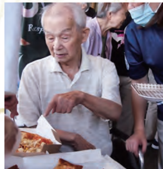
これも食べたいよな。