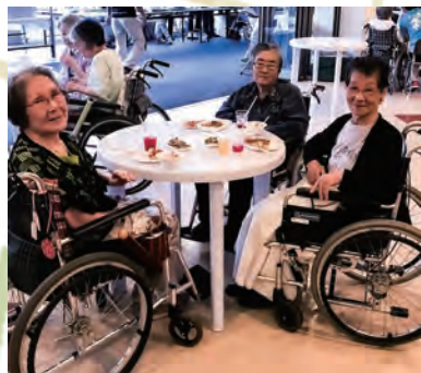
3人寄ればお喋りも弾みます。“冷やしおでん”最高でした。