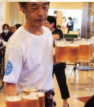
両手にビールジョッキを10個。 凄技！（職員です）