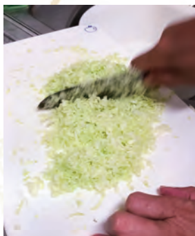
キャベツは細かく みじん切りに！