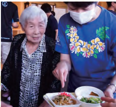
こんなに食べられるかな？