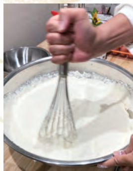
小麦粉+出汁+長いも +卵を混ぜて…