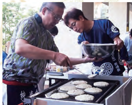
鉄板でじっくり焼き上げ……完成！