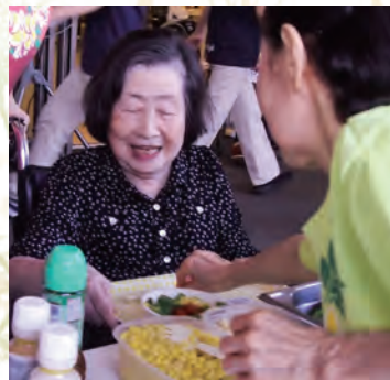
あらー、美味しそう！