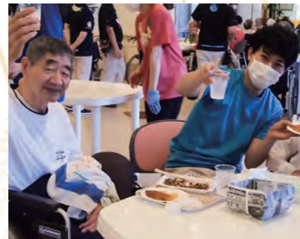
職員も一緒にカンパイ！