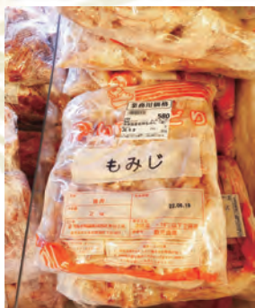
出汁は鶏もみじ（鶏爪）