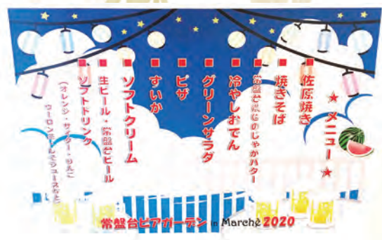
本日の“お品書き” ご馳走様でした。