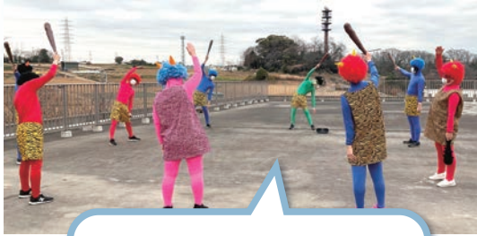
鬼も気合十分でしたが……