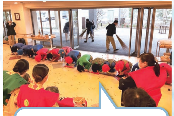
皆さんのパワーに“参りました(涙)”