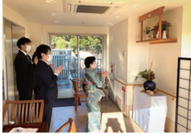
祝膳の前に、神棚にお祈り。